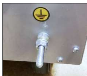
Рисунок 6 Клемма защитного заземления