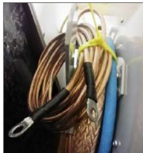
Рисунок 8 Кабель заземления с наконечниками

4.2. Принцип работы установки основан на заряде высоковольтной накопительной емкости, а затем подключении емкости при помощи высоковольтного коммутатора к поврежденному силовому кабелю.