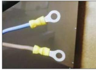
Рисунок 7 Наконечники кабеля питания

- кабель для подключения питания от сети 220 В, 50Гц (см. Рисунок 1, поз.3) с наконечниками Рисунок 7.