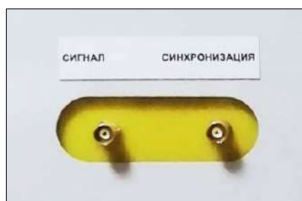
Рисунок 4 Разъемы для подключения рефлектометра