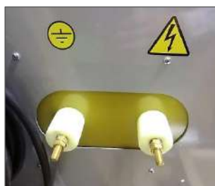
Рисунок 5 Высоковольтные выводы генератора