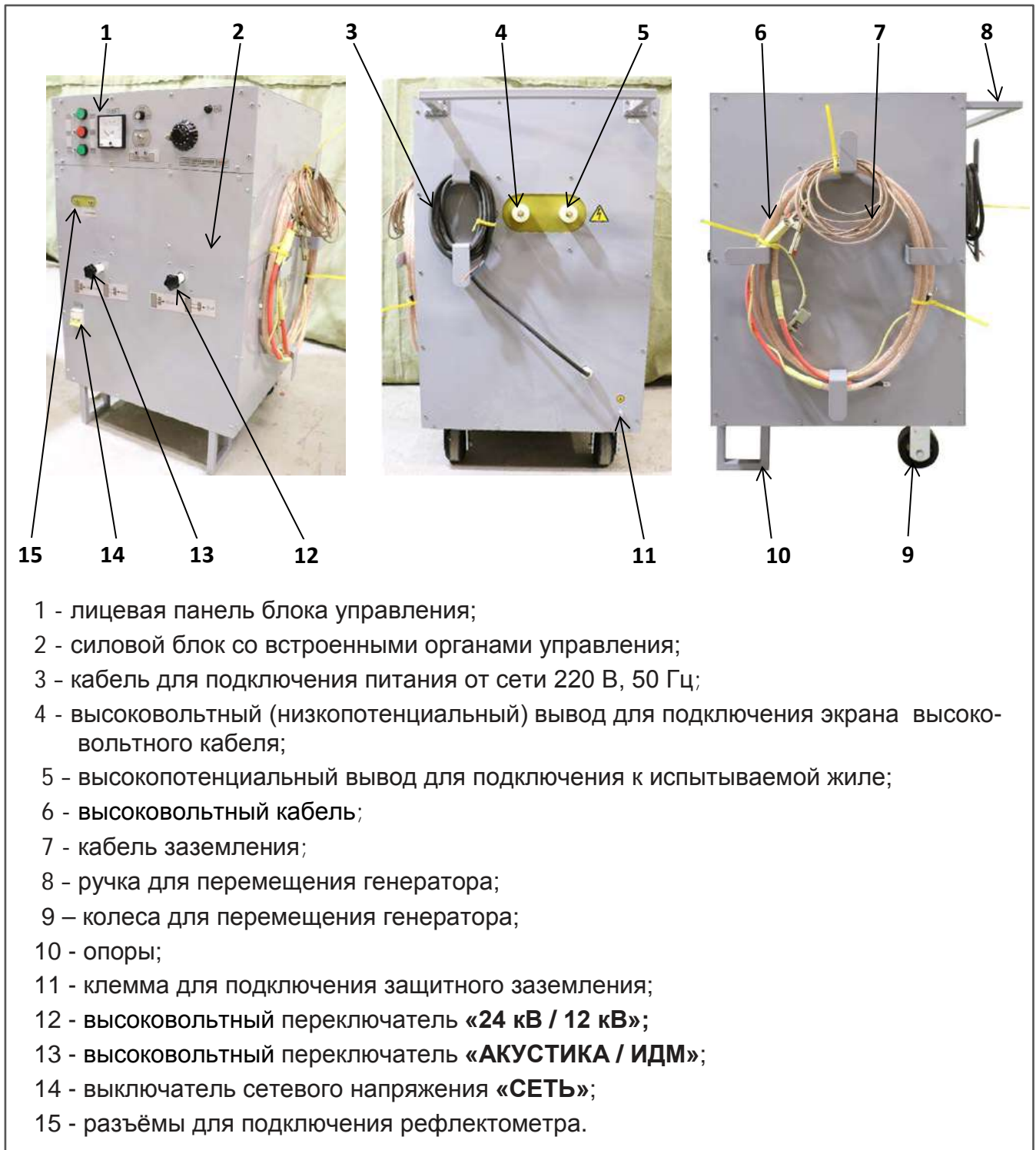
Рисунок 1 Внешний вид генератора ГВИ-24.3000ИДМ

4.1. Конструктивно генератор представляет собой силовой блок прямоугольной формы со встроенными органами управления. Конструкция каркасного типа из стальных труб прямоугольного сечения со стальными окрашенными панелями. Генератор имеет два колеса, два упора, ручку, и в наклонном положении его можно перемещать на колесах – Рисунок 1.